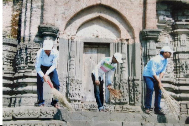
Cleanness Drive of Temples