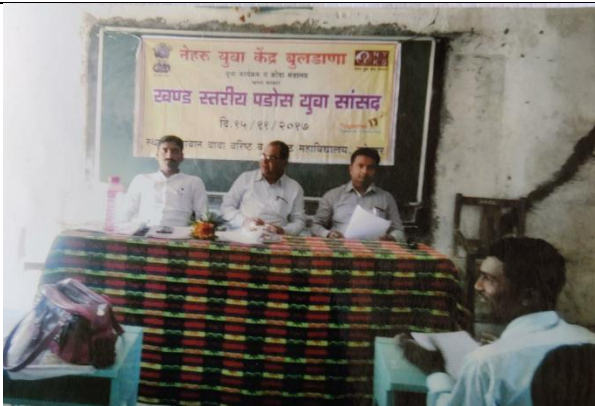
Khandiy Yuva Sansad