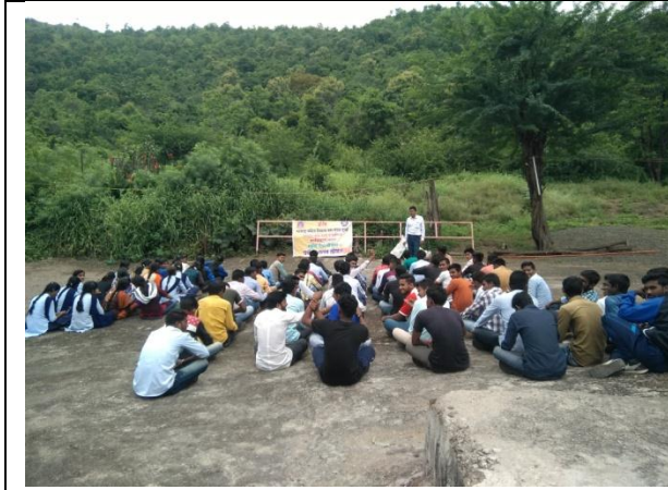
Payrtan Club 2018-19