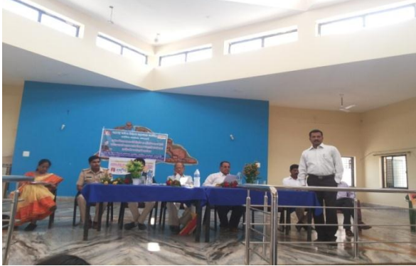
Payrtan Club 2014-15