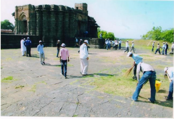
Cleanness drive at Datsudana Temple 2014-15