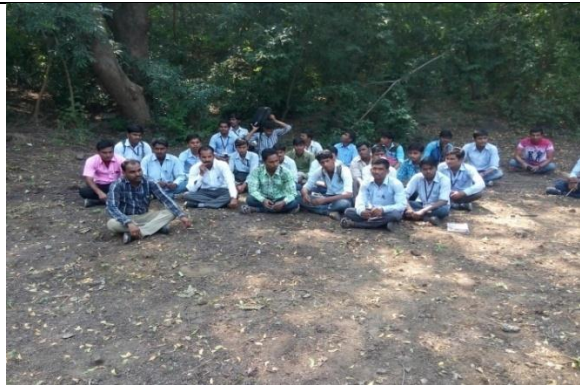
Study Tour 20115-16