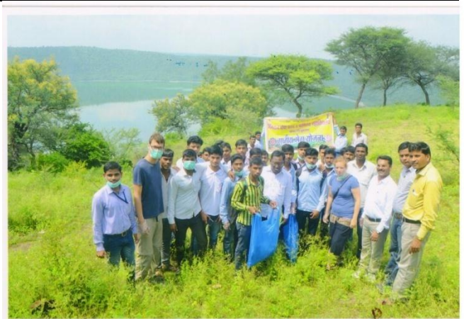
World Tourism Day and Cleanness Drive 2016-17