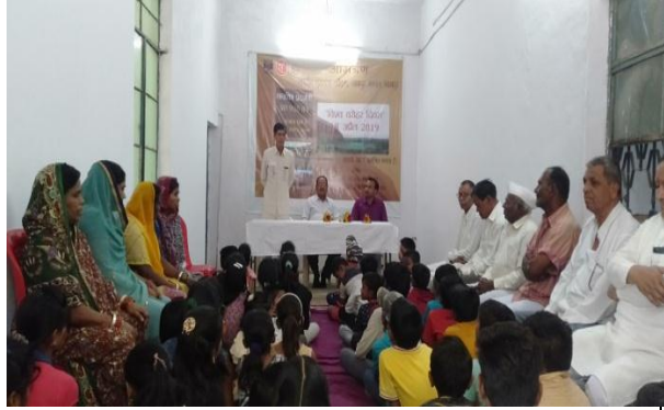
World Heritage Day 2018-19