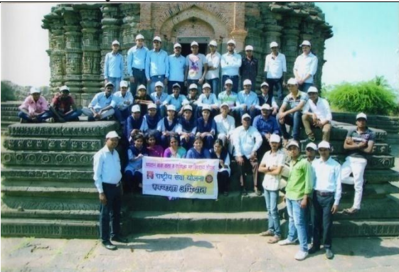
Payrtan Club 2016-17