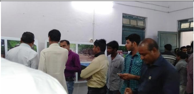
Archaeological Survey Of India Exhibition