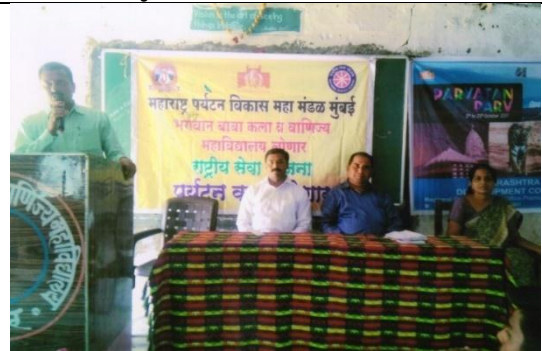
Payrtan Club 2017-18