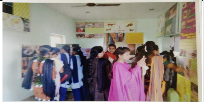
Forest Department Exhibition 2018-19