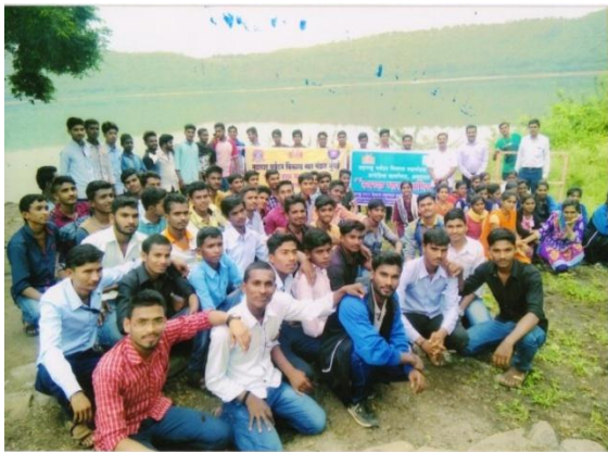
World Tourism Day and Cleanness Drive 2017-18