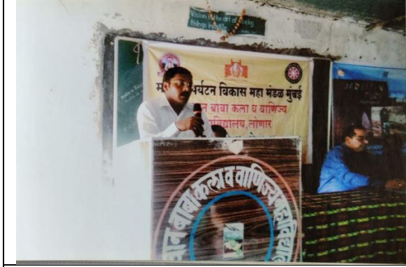
Paryatan Parv 2017-18