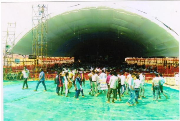
Cleanness Drive in Lonar Mohostav 2016-17