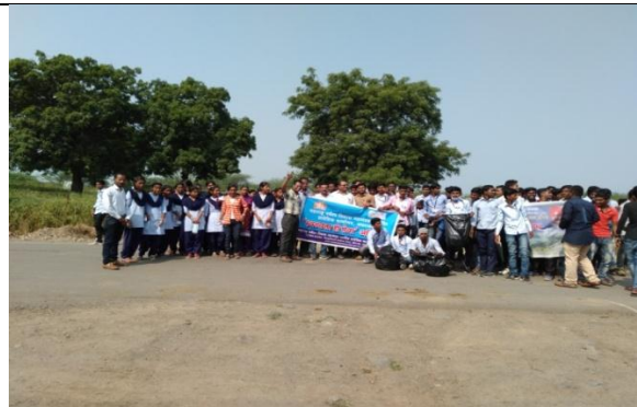
World Tourism Day and Cleanness Drive week 2018-19