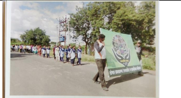
Wild Life Week 2017-18