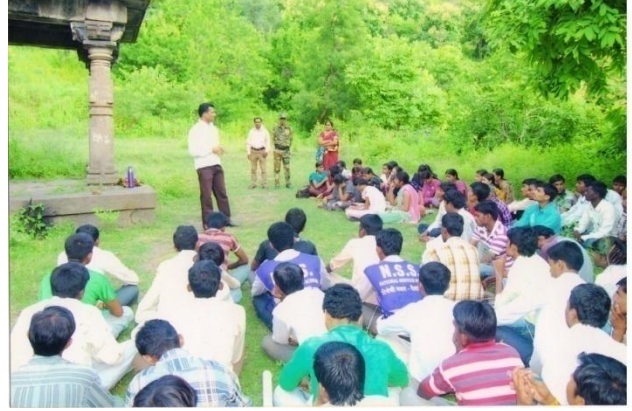
Study Tour 2014-15