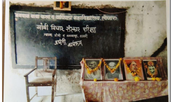
Gandhi Vichar Sanskar Pariksha 2017-18