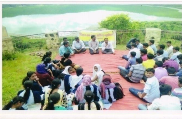
Wild Life 2016-17