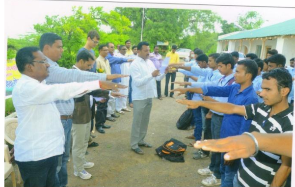
Payrtan Club 2015-16